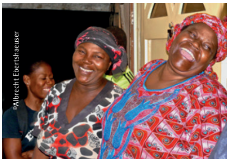
Lebensfreude – Frauen aus Nigeria

Kommen auch Sie! Wir hören die Stimmen aus Nigeria, lassen uns von ihrer Stärke inspirieren und bringen unsere eigenen Lasten vor Gott. Diese Gottesdienste sind immer informativ und sehr berührend! Sie machen den Blick weiter – über den eigenen Tellerrand hinaus, ermöglichen oft ganz unbekannte Sichtweisen auf Länder, Gebräuche, Schwierigkeiten und den dennoch gelebten Glauben dort.